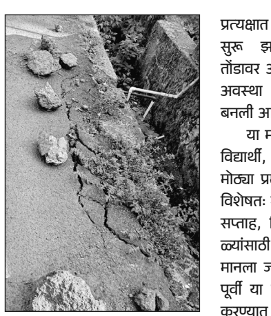
उगवे : महादेव मंदिर-देवळी मार्गावरील खचलेला रस्ता.

प्रत्यक्षात अद्याप कोणतेही काम सुरु झालेले नाही. पावसाळा तोंडावर आलेला असताना रस्त्याची अवस्था अधिकच धोकादायक बनली आहे.